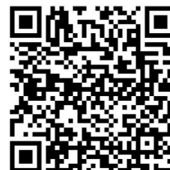
Angebote für Senioren

Störfallnummer Main Kinzig (Strom, Gas, Wasser) - Notdienst: 06051-884040