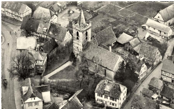
Evangelische Kirche, 1958