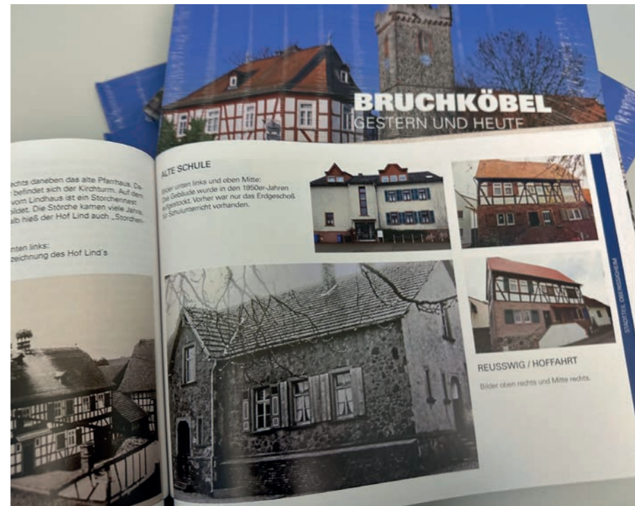
Die dritte Auflage des Foto-Bildbandes „Bruchköbel: Gestern und heute“ ist ebenfalls im Stadtladen erhältlich.

Auch die mittlerweile dritte Neuauflage des Bildbandes „Bruchköbel: Gestern und heute“, ist seit November im Stadtladen zu erwerben. Auf über hundert Seiten finden sich historische und aktuelle Fotos aus ganz Bruchköbel. Bereichert werden die Bilder - die aktuellen stammen zum Großteil vom Butterstädter Jürgen Foisinger - durch viele persönliche Geschichten