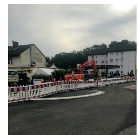
Die Buslinien fahren die Umleitung über die Breslauer Straße (Bild links), der Autoverkehr wird weiträumig über Waldseestraße und Hauptstraße umgeleitet.