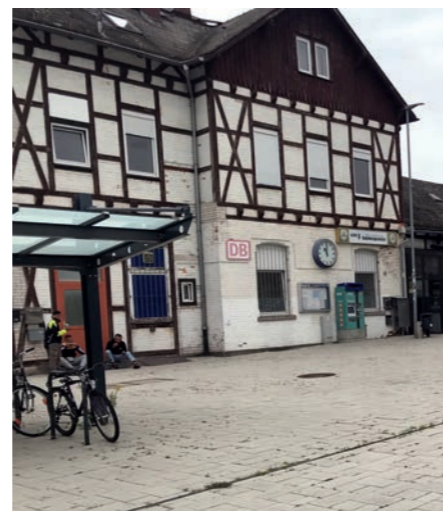
Die Pläne zum barrierefreien Umbau des Bruchköbeler Bahnhofs werden von der Deutschen Bahn schon seit einigen Jahren verfolgt.

Umbau Bahnhof: Der Umbau des Bahnhofs für einen barrierefreien Zugang zu den Zügen soll im Januar 2024 starten. Wie bereits 2013 von der Stadtverordnetenversammlung beschlossen, wird eine Unterführung mit Aufzug entstehen, die den sicheren Zugang zu beiden Gleisen ohne Barrieren ermöglicht. Erste vorbereitenden Maßnahmen erfordern laut Deutsche Bahn nur kurzfristige Sperren. Die Maßnahme soll größtenteils unter Normalbetrieb durchge-