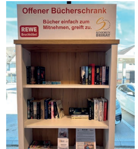
Viele Bücher haben hier schon neue Benutzer gefunden: Der offene Bücherschrank am Rewe wird rege genutzt.

Da der Supermarkt von vielen Bürgerinnen und Bürgern frequentiert wird, erhoffen sich die Initiatorinnen und Initiatoren des Bücherschranks eine schnelle Akzeptanz des Angebots. Mittlerweile wird der Offene Bücherschrank von Jung und Alt rege genutzt.