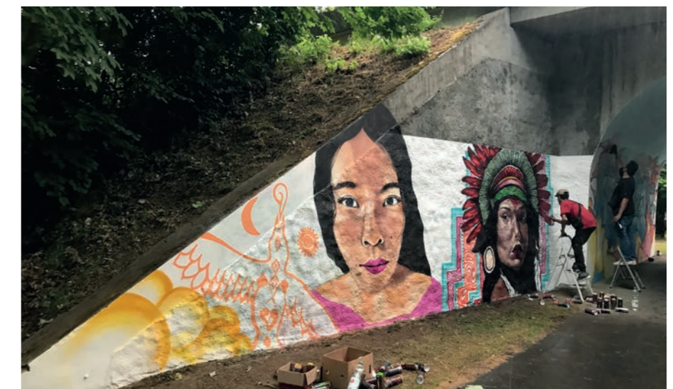
Das Jugendzentrum holte internationale Graffiti-Künstler nach Bruchköbel, die unter anderem die Unterführung am Eidmann farbenfroh verschönert haben.

kunstwerk entstand, das sich thematisch an der benachbarten Metzgerei orientiert. Jugendreferent Dieschburg begleitete die Künstlerinnen und Künstler bei ihrer Aktion. „Wenn Graffiti-Künstler eine öffentliche Fläche gestalten, werten sie diese mit ihrer Kunst auf. Das zeigt insbesondere Jugendlichen, was mit Graffiti möglich ist.“