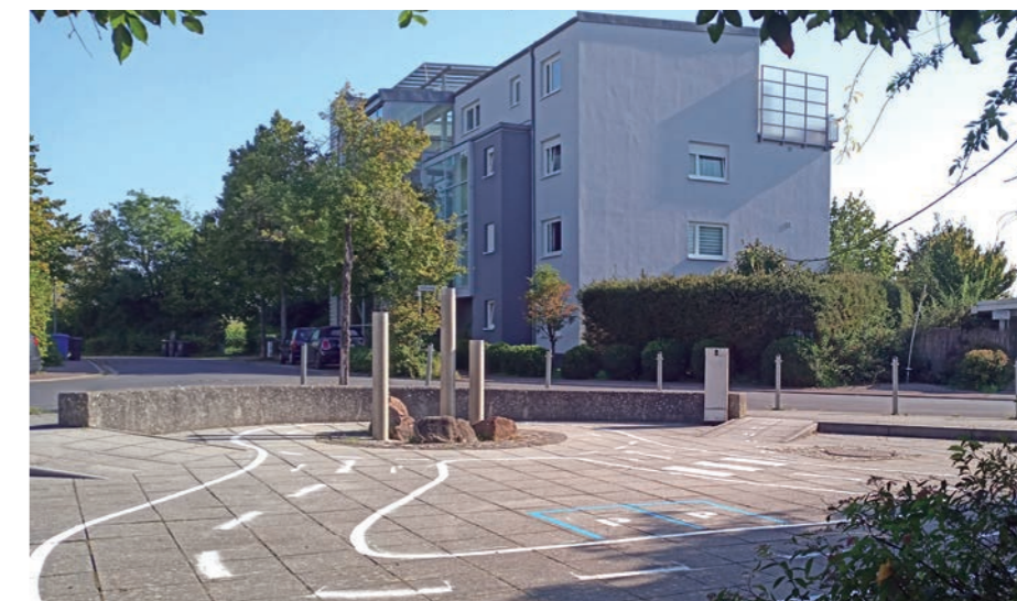
Auf der neuen Spielstraße Am Römerbrunnen im Wohngebiet Peller I können Kinder mit Bobbycars oder Laufrädchen viel Spaß haben.

Im Herbst wird ein weiteres neues Spielgerät erwartet und auch die Reparatur der an der Skater-Anlage gesperrten Geräte steht auf dem Plan.