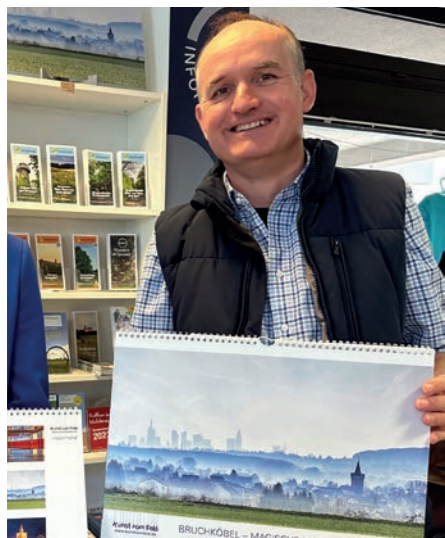
„Magische Momente“ heißt der Fotokalender des Fotografen Michael Joest.

Der Fotograf Michael Joest hat für 2024 einen Fotokalender mit ganz besonderen Aufnahmen von allen Bruchköbeler Stadtteilen gestaltet. Er ist bereits bekannt mit seinem Projekt „Kunst im Feld“, bei dem er seine künstlerischen Schnappschüsse mit witzigen Versen unterlegt. Zu den Postkarten und Kunstdrucken von ihm, die es bereits im Stadtladen gibt, gesellt sich nun ein Bruchköbel-Kalender 2024 mit dem Titel: „Magische Momente“.