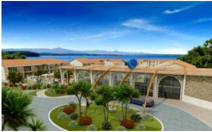
Hotel Sporting Golf in Moniga del Garda

Das Sporting Golf Hotel**** in Moniga del Garda ist ein neu erbautes, im Juli 2008 eröffnetes 4-Sterne Haus. Mit seiner ruhigen, leicht erhöhten Lage und herrlichem Panoramablick über den See, eingebettet in die mediterrane Vegetation mit Olivenbäumen, ist das Hotel der ideale Startplatz für unsere zahlreichen Ausflüge.