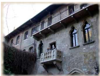
Balkon von Romeo und Julia