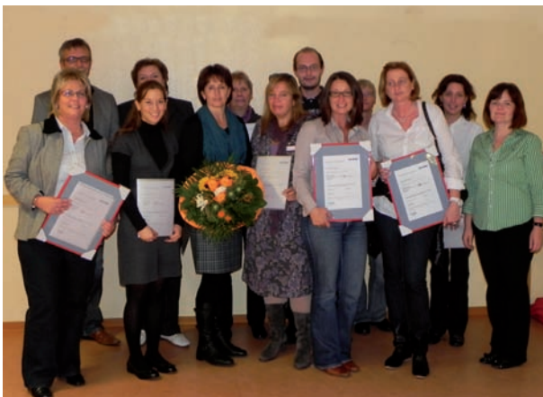
Das stolze Team der AWO.

Um dies alles zu steuern gibt es in der AWO eine Stabstelle Qualitätsmanagement sowie in allen Einrichtungen speziell geschulte Qualitätsbeauftragte. Jährlich