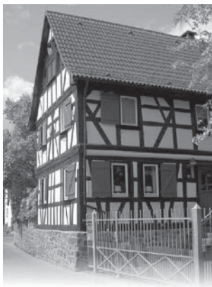
In der Heplergasse