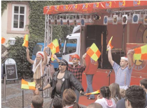
Die Keweler Elfen stimmten mit ihrem Tanz "Village People" das Publikum auf die Läufe ein

Strahlendes Wetter und blauer Himmel über dem Bruchköbeler Freien Platz passten hervorragend zu Logo und dem roten Lauf rad, dem "hr3-stromodrom", des hessischen Radiosenders. Darin konnten Bruchköbeler und Gäste Gratistrom "erkrabbeln". Auf dem Freien Platz war schnell aufgebaut, was es zur Aktion brauchte: das "stromodrom" und eine Bühne. Die Kelterei Walther, die Fischzucht Augustin, der Ratskeller, das Restaurant Aloysius und die Landfrauen Niederissigheim hatten sich für Durst und Hunger der Besucher gerüstet. Vom Stromburger bis zum Energiekringel mit Milchstrassensauce konnten die Besucher und Mitstreiter ihren Durst nach Energie auch in Form von Kalorien stillen.