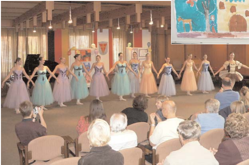
Die Ballettschülerinnen der Ballettschule Weinlich bezauberten mit Anmut und Können die Besucher im Stadtverordnetensitzungssaal