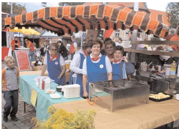
Die Energiekringel mit Milchstrassensauce der Landfrauen Niederissigheim fanden reißenden Absatz