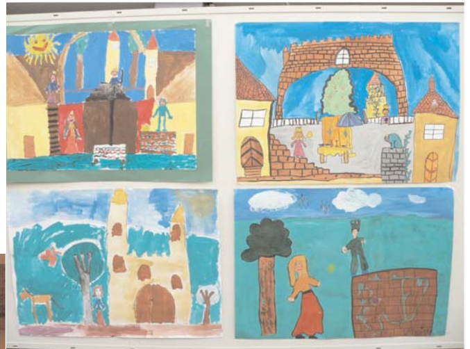
Bilder der Kinder zum Thema Märchen

Unter dem Motto „Palette der Kunst“ hatten die Kinder der Kunstschule Auf-