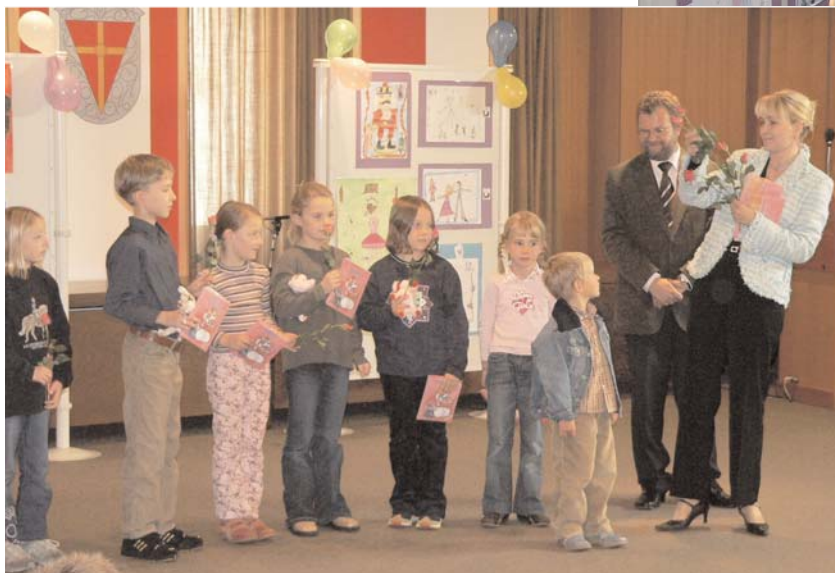
Die kleinen Künstler erhalten zum Dank ein Geschenk

Musikalisch wurde die Feier von Darbietungen an Klavier, Flöte und Melodica untermalt.