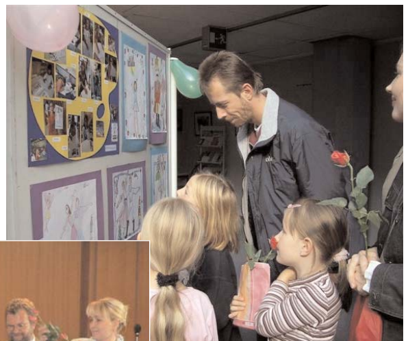
Aufmerksam betrachten Kinder und Erwachsene die Kunstwerke im Rathaus

führungen der Märchenfestspiele, die Ballettschule sowie Museen besucht, um ihre Eindrücke danach in Bildern festzuhalten. So sind im Rathaus unter anderem Bilder zum Froschkönig, Tanz und erste Kopien alter Meister zu sehen. Themen wie Diddlmaus, Indianer, Selbstportrait oder Tiere haben die Schülerinnen und Schüler im Alter von 4 bis